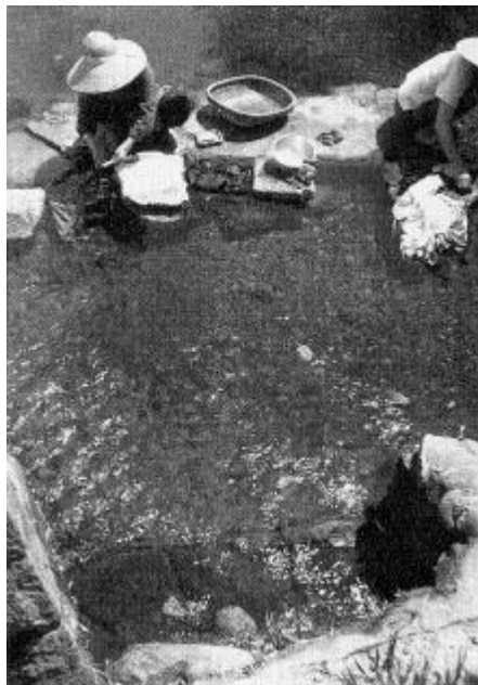
がけしたのわき水